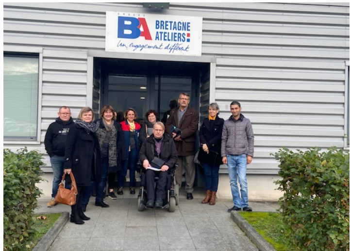
Visite de l'entreprise adaptée Bretagne Ateliers