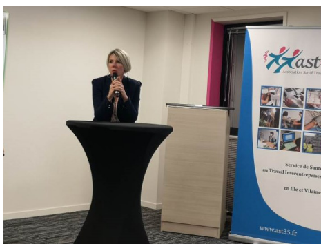
Table ronde organis e par Cap emploi 35, l'Agefiph, LADAPT et l'AST 35.

Intervention sur la RQTH, exemples de parcours de salari s maintenus sur leur poste de travail.