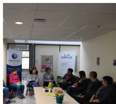
Table ronde organis e au P le Emploi Vitr  en pr sence de 19 candidats, le CLPS de Vitr  et l'entreprise Lactalis .

T moignage d'un candidat sur son parcours professionnel, conseils sur le handicap lors des entretiens.