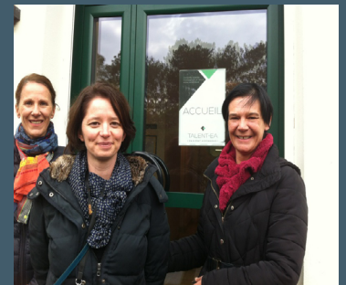
Cap emploi 56, Pôle emploi et Cap emploi 35 lors de la visite de Talentéa à Redon