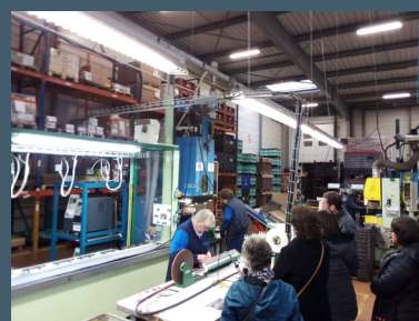
ABS - Vitré