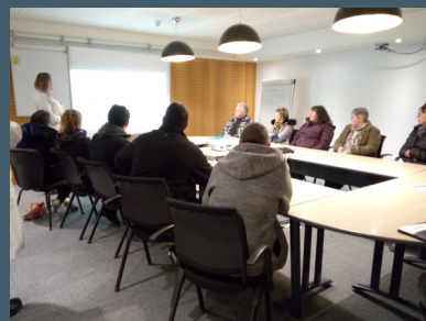
Delta Dore - Bonnemain